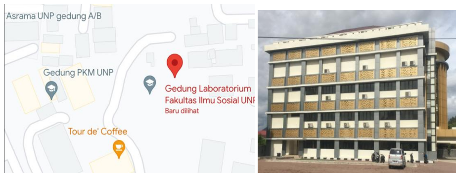
Gambar 1. Gedung Laboratorium Fakultas Ilmu Sosial

Gedung ini adalah gedung yang baru saja selesai dibangun pada awal tahun 2023 dengan total 4 lantai. Terdapat 2 buah lift yang berada pada tengah- tengah gedung. Selain itu, pada gedung ini juga terdapat Auditorium, Kantor Pasca dan beberapa ruangan pindahan ICR A yang dilengkapi beberapa perlengkapan listrik yang memerlukan kualitas daya listrik yang baik [8].